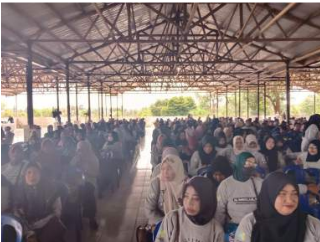
Foto 4. Foto Para Masyarakat Warga Kec Tambang Ulang