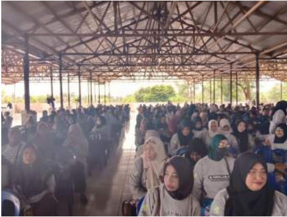
Foto 9. Foto Bersama Undangan, Panitia, Narasumber dan Peserta (Warga Tambang Ulang)