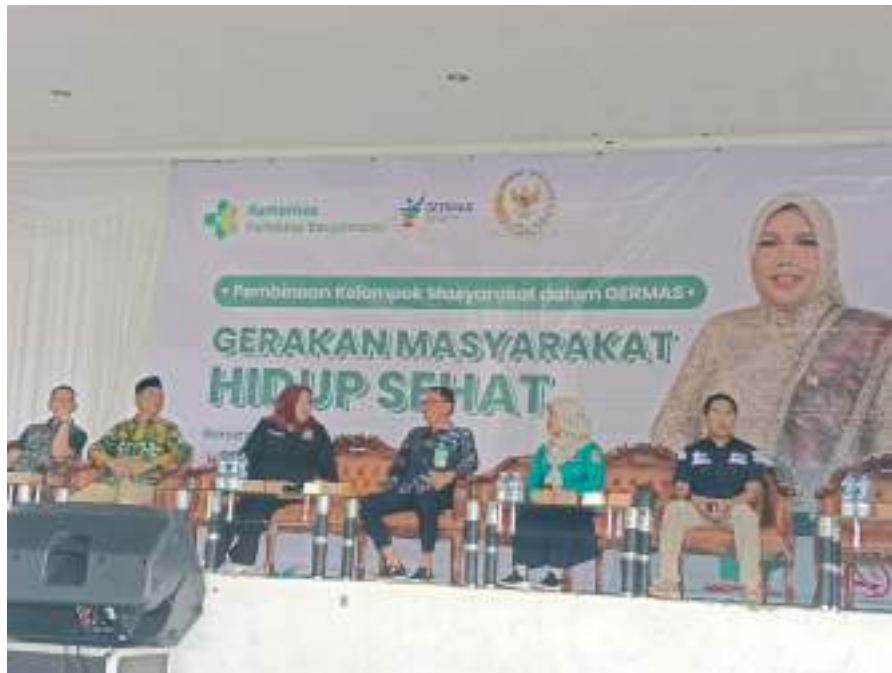
Foto 3. Para Narasumber