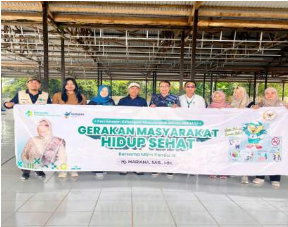
Foto 1. Panitia Dari Poltekkes Kemenkes Banjarmasin